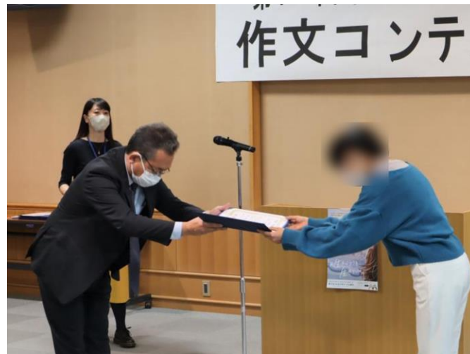
表彰式（東灘区役所）