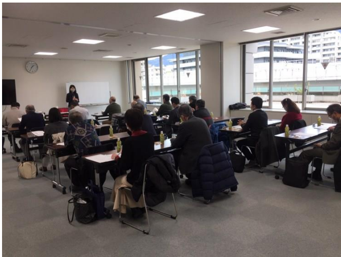
主任官による定例研修（年4回）

令和4年度 東灘区保護司会 第8回オンライン自主研修 【集合ZOOM研修】のご案内