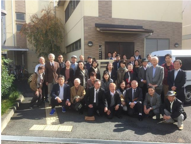
矯正・更生施設訪問