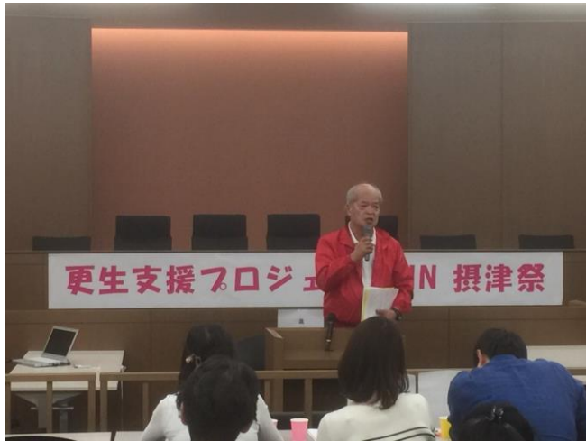
甲南大学「更生支援プロジェクト」