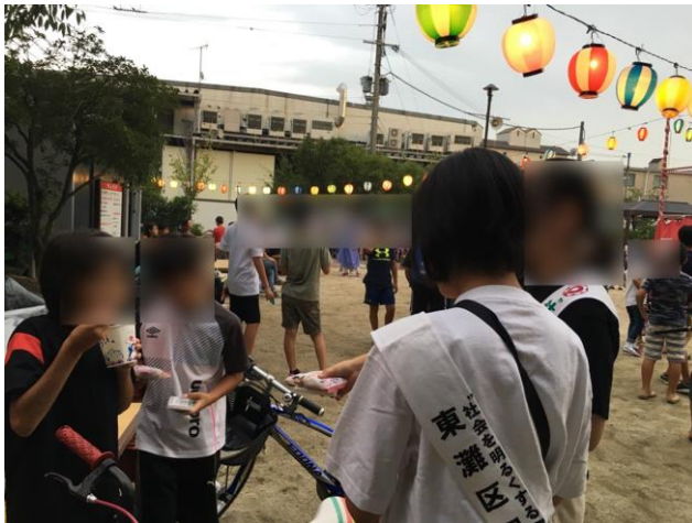
“社会を明るくする運動” ティッシュ配り