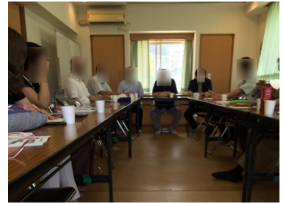
地域諸団体会議に出席