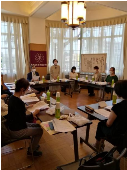
更生保護女性会総会