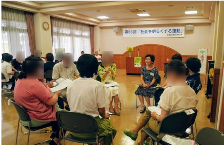
“社会を明るくする運動”ケース研究（魚崎支部）