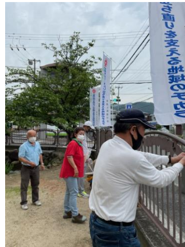
“社会を明るくする運動” 幟の設置