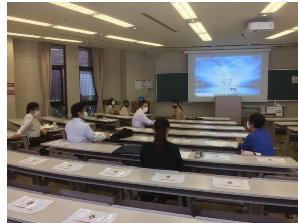
東灘区更生保護 4 者代表者会議