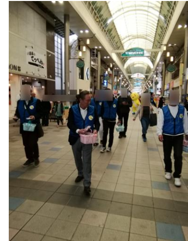
薬物乱用未然防止活動