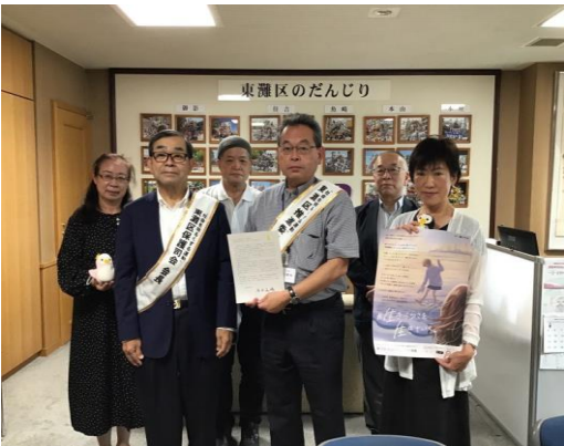
“社会を明るくする運動” 内閣総理大臣メッセージ伝達式