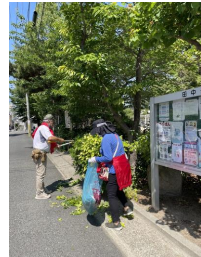
区内一斉清掃に参加（本山支部）