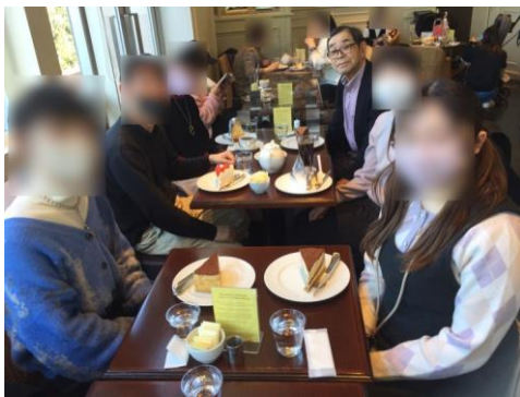
茨城県 B B S 会と情報交換会