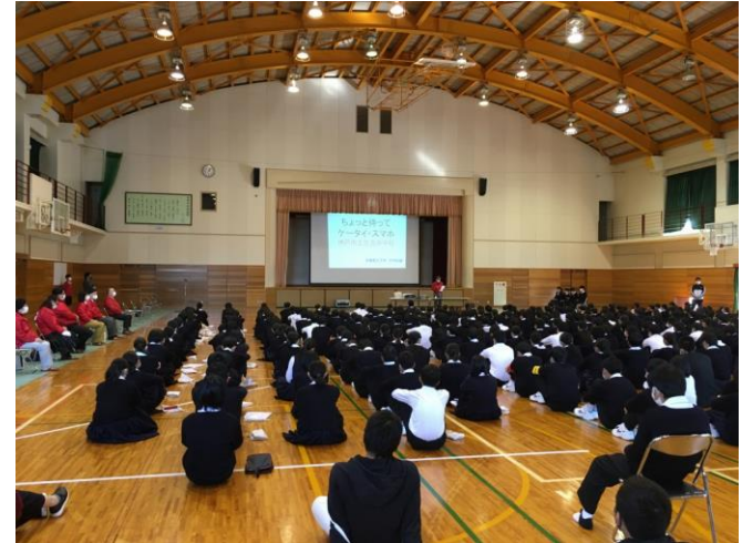
中学校「中学校との連携強化事業」