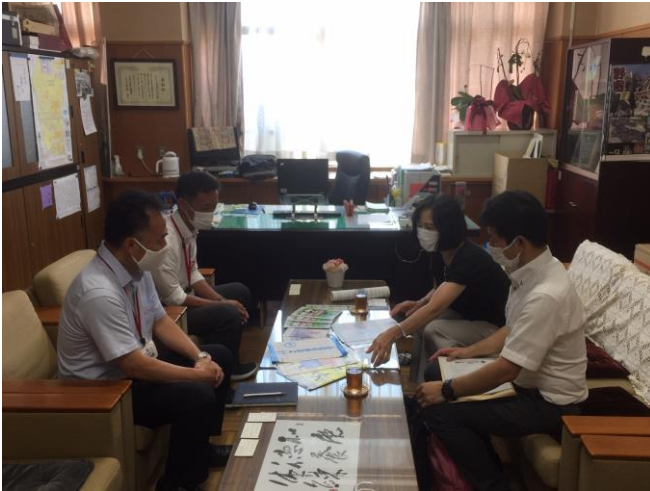
小学校「作文コンテスト応募の依頼」