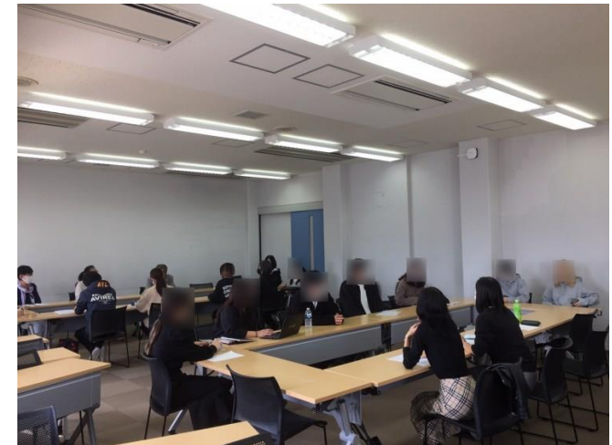
関西国際大学「サービスマーケティング」