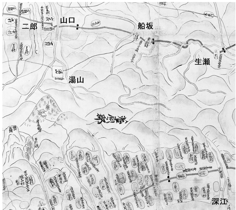
図1 「慶長国絵図」にみる六甲山（にしのみやデジタルアーカイブより）

深江の北側には西国街道が描かれているが、この道の太さと山間部を通る生瀬―船坂―山口―二郎の街道がほぼ同等の太さで描かれている。加えて、生瀬、東船坂、金谷寺付近の街道に「・・」印、すなわち一里塚があることにも注目したい。慶長年間はまだ全国統一的な一里塚があるのは驚きだ。中世末から近世初頭にかけての京都から摂津北部を通過して播磨に抜ける街道の重要性がうかがえる。