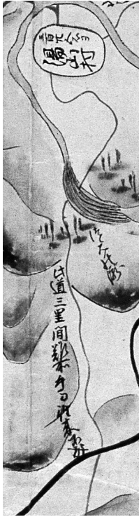
図3 魚屋道には「難所、牛馬往来不成」と書かれている

魚屋道は難所だったようで、「此道三重間難所、牛馬往来不成」と牛馬の往来はできないと書いている(図3)。唐櫃から魚屋道に合流する道も描かれ、こちらは「常二牛馬往来難成(なりがたき)」なので、「往来ならず」より道はまじだったようだ。「国絵図」には住吉から登る住吉道などは描かれておらず、尼崎藩や江戸幕府は湯山間道の中で魚屋道を最も重要と考えていたと思われる。「国絵図」に描かれている以上、存在が否定された道だとは思えない。