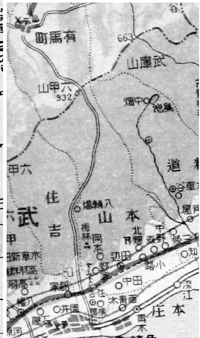
図6 「日本交通分県地図 兵庫県」(神戸深江生活文化史料館蔵)には住吉道だけが太く描かれている