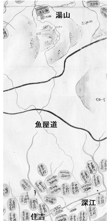
図4 「元禄国絵図」(国立公文書館蔵)には「難所」の記載はない。

天明六年(一七八六)には深江を含む本庄九カ村が道の修復に協力することや、「奥筋揚ヶ駄荷物」を運ぶために牛の数を定める申し合わせをした。申し合わされた牛の数は、深江には二〇頭、本庄九カ村では計一八九頭の牛を置くことで合意している。「正保国絵図」では牛馬